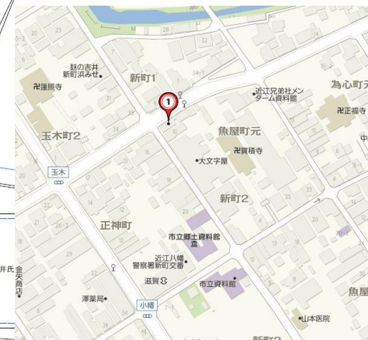
物販店、飲食店に最適です・・・!